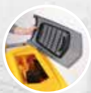
Фильтр для крупного мусора + фильтр защиты всасывающей турбины