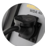
Розетка для электроинструмента