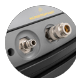
Комплект COMBI (опционально)